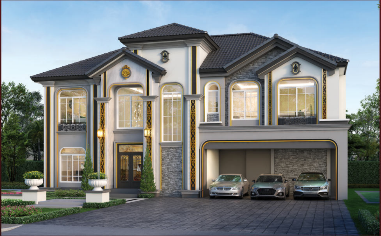
SALZBURG (ซาลซ์บวร์ก) พื้นที่ใช้สอย 364 ตร.ม