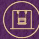
PLAYGROUND / KID PARK

สวนสาธารณะยังคง CONCEPT เดิม ล้อกันมากับ STYLE ของตัวบ้านและอาคารสโมสร " HYDE PARK LONDON " เป็นสวนสาธารณะชื่อดังของประเทศอังกฤษที่ได้รับความนิยมตลอดกาล มีพื้นที่กิจกรรมหลากหลายภายใต้ความร่มรื่น และสามารถเข้าถึงได้ทุกโซน