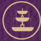
JOY OF LIFE FOUNTAIN