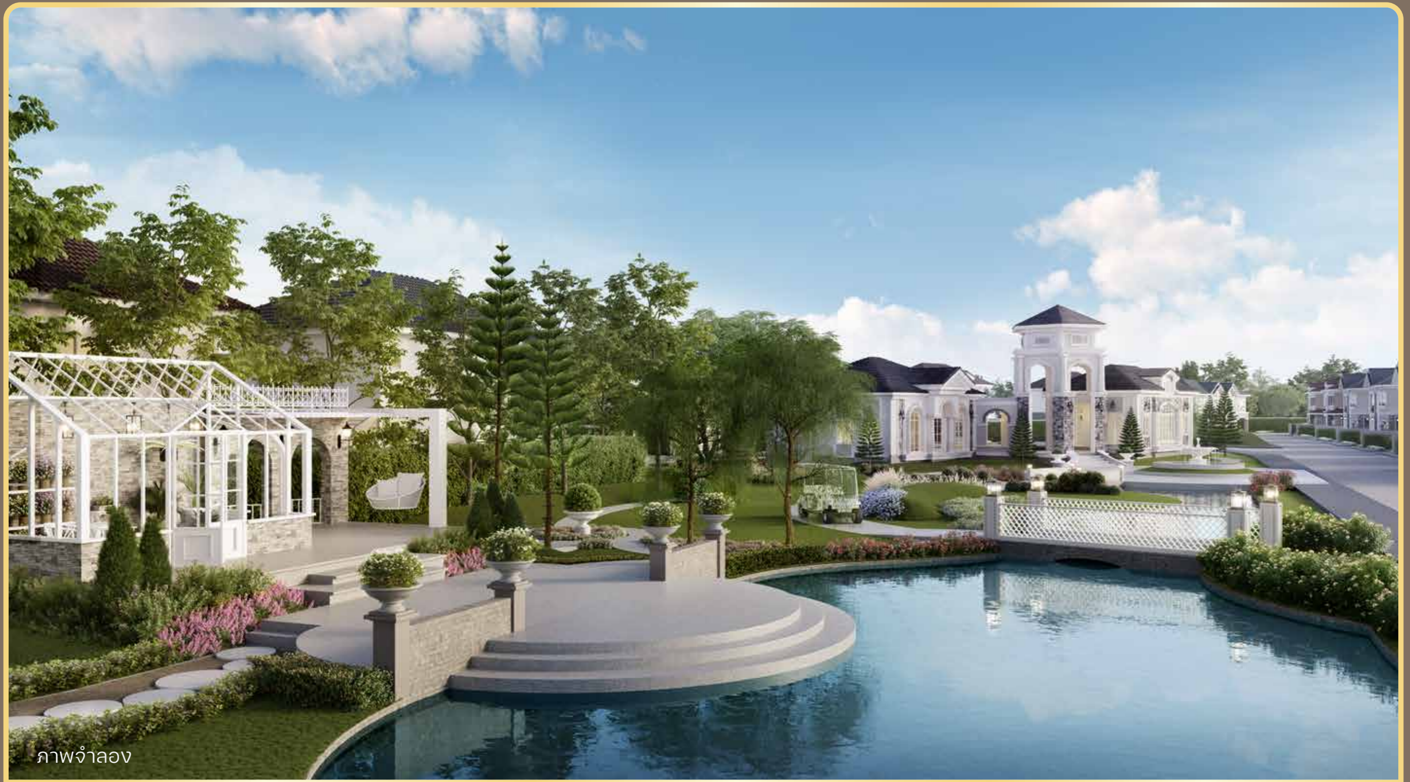
ภาพจำลอง